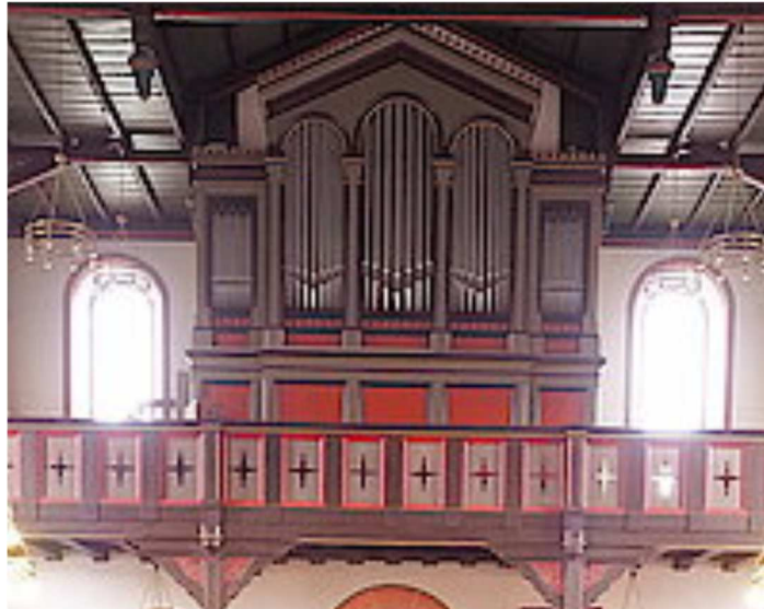
Orgel in St. Georg, Oberreifenberg (Foto: © F. Sieweke) Christian Friedrich Voigt, Igstadt, 1855, 2 Manuale/Pedal, 25 Register Manual- und Pedalkoppel; größte (historische) Orgel der Pfarrei (Foto: © F. Sieweke)