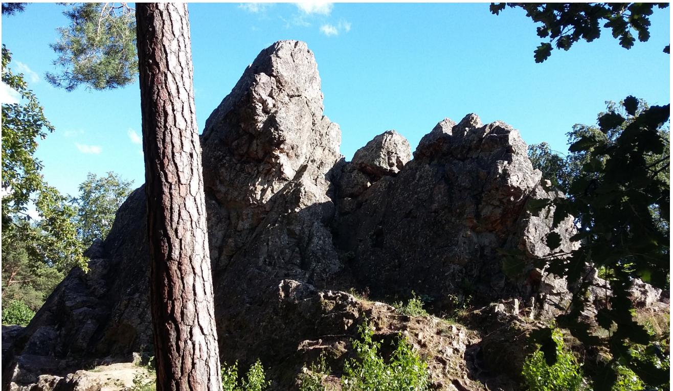
Der "Saienstein" bei Usingen-Eschbach